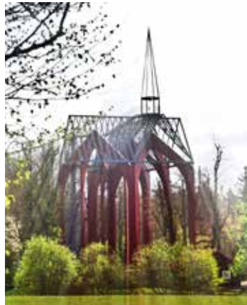
Das Kloster Ihlow

Vor 10 Jahren hat man einen Pilgerweg auf alten Spuren wieder ins Leben gerufen. „Schola Dei“ – „Schule Gottes“ hat man ihn nach dem Ausgangspunkt, dem Kloster Ihlow, genannt. Es ist eine Strecke von rund 42 km bis nach Norden, die man über mehrere Tage pilgert und dabei an vielen verschiedenen Stationen Halt macht. Ob man die Strecke alleine gehen möchte oder mit einem Pilgerführer, ob es die mittelalterlichen Spuren sind, die ostfriesische Landschaft, die man neu entdecken kann, oder ob man ganz einfach mal abschalten möchte, dieser Pilgerweg ist eine Erfahrung wert. Pilgern ist eine Wohltat für