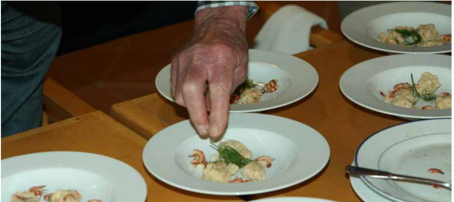
Es wird zum Essen angerichtet.

Brennt bei Ihnen auch immer das Wasser an? Oder haben Sie einfach Lust, sich mal in geselliger Runde am Herd auszuprobieren? Dann sind Sie richtig bei unserem Kochtreff für Männer! An jeweils zwei Terminen vormittags und abends wollen