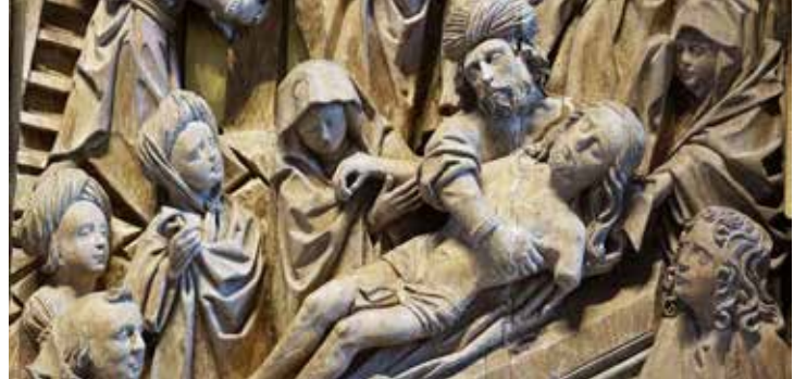
Jesu Grablegung, Ausschnitt aus dem Altarretabel der Ev.-luth. Kirche Loquard, geschnitzt, 1520-1525