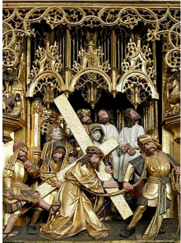
Kreuztragung Jesu, Ihlower Altarretabel in der Lambertikirche Aurich, geschnitzt, Antwerpen 1500-1510