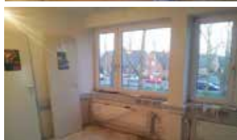
Die Baustelle