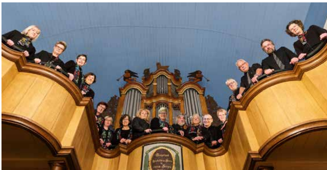
Gospelchores Riepe

Die Sängerinnen und Sänger des Gospelchores Riepe unter Anleitung ihres Chorleiters Konstantin Scharonow haben ein umfangreiches Programm zusammengestellt. Aus Freude an der Musik gesellten sich neben dem Gospelgesang auch andere Musikrichtungen in das Repertoire, darunter deutsches und plattdeutsches Liedgut. Seit 2013 treten unter dem Namen „The Chambers“ die Stimmführer und Solisten des bekannten Synchronorchesters „Junge Philharmonie Köln“ europaweit auch als Kammermusikensemble auf. Das renommierte Ensemble verfügt über ein ausgesprochen weitgefassetes Repertoire klassischer und populärer Musik, wobei die Programme von virtuos vorgetragenen Solos über Werke für Kammerorchester bis hin zu den beliebtesten