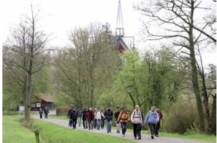
Nach der Andacht unterwegs zum nächsten Ziel.

Pilgern ist angesagt: Auf dem Jakobsweg nach Santiago de Compostella kommt es inzwischen zur Problemen wegen Überfüllung, ständig werden neue Pilgerwege entdeckt. Immer mehr Menschen finden Gefallen daran, ihren Körper herauszufordern und der Seele Luft zu schaffen. Unsere alljährliche Pilgerwanderung am Gründonnerstag von Ihlow nach Emden findet in diesem Jahr zum 8. Mal statt. Wir treffen uns am 29. März um 9.30 Uhr an der Martin-Luther-Kirche, Bollwerkstraße 17, fahren mit dem Bus zur Klosterstätte Ihlow und beginnen dort den Tag mit einer Andacht im „Raum der Stille“. Anschließend wandern